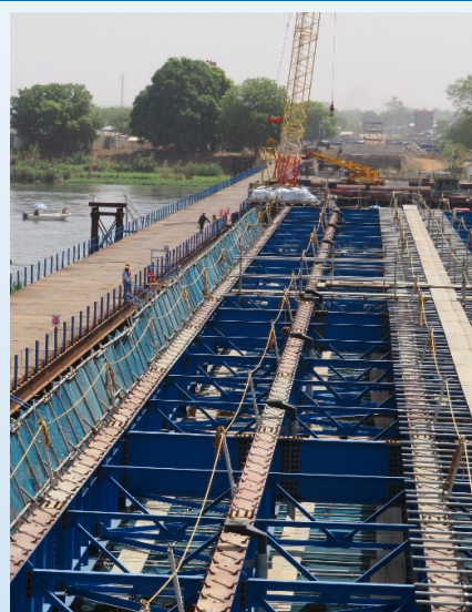
日本の支援によるジュバのFreedom Bridge 建設現場（2019年3月）