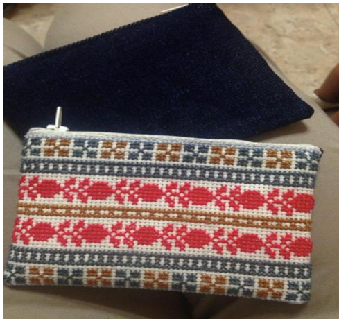
サイズ 10cm × 13cm 定価: 1,100円