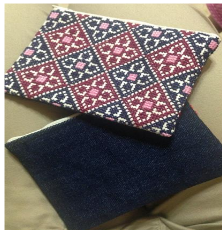
サイズ10cm × 13cm 定価: 1,200円