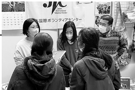
大阪のワン・ワールド・フェスティバルに出展。OBOGの皆さまも来場くださり、たくさんお話ししました！

学内収集で協力してくれたほか、山梨県韮崎市、静岡県裾野市、北海道石狩市でもスタッフや理事、インターン、ボランティアの働きかけにご共感いただき、大々的に集めていただきました。ニュースにも多数掲載され、多くのお問い合わせがきています。スーダンの現地スタッフもとても喜んでます。結果は現在集計中です。皆さま、ありがとうございました！