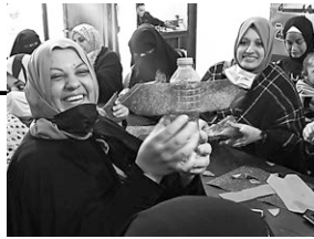
おもちゃ作りワークショップでペットボトル飛行機を作っているところ(ガザ)

●女性の生計向上とエンパワメント事業(東エルサレム): 昨年12月のクリスマスバザーに29名の女性が参加、自身の商品やサービスで売上を得る経験をしました。また、1月にはビジネスを開始した参加者が集い、お互いの経験を共有して学び合いました。さらに男性向けのスタディツアーおよび研修も行い、45名の男性が女性のビジネスや権利の理解を深めました。46名中45名の女性が職業技術訓練を修了し、約7割の女性が技術習得に自信をもってビジネスを実施または計画しています。