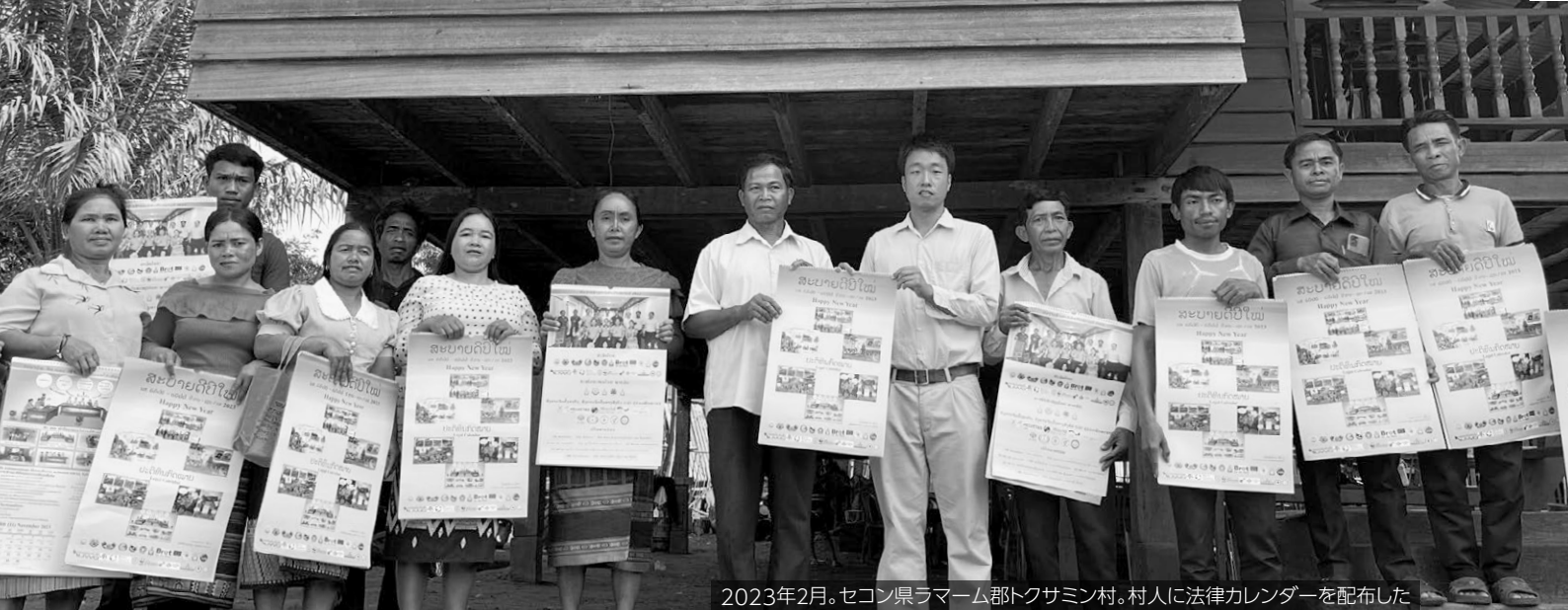
2023年2月。セコン県ラマーム郡トクサミン村。村人に法律カレンダーを配布した