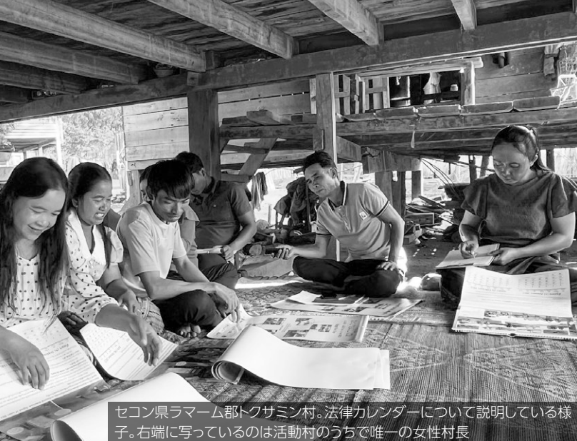
セコン県ラマーム部トクサミン村。法律カレンダーについて説明している様子。右端に写っているのは活動村のうちで唯一の女性村長

話し合いなどを行っています。村の共有資源を持統的に管理・利用する仕組みの導入では、村人と話し合い、その村に最も適した仕組みを選択しています。2022年度は2村でコミュニティ林と魚保護地区を設置し、近隣の村人や行政官を交えた式典を実施しました。