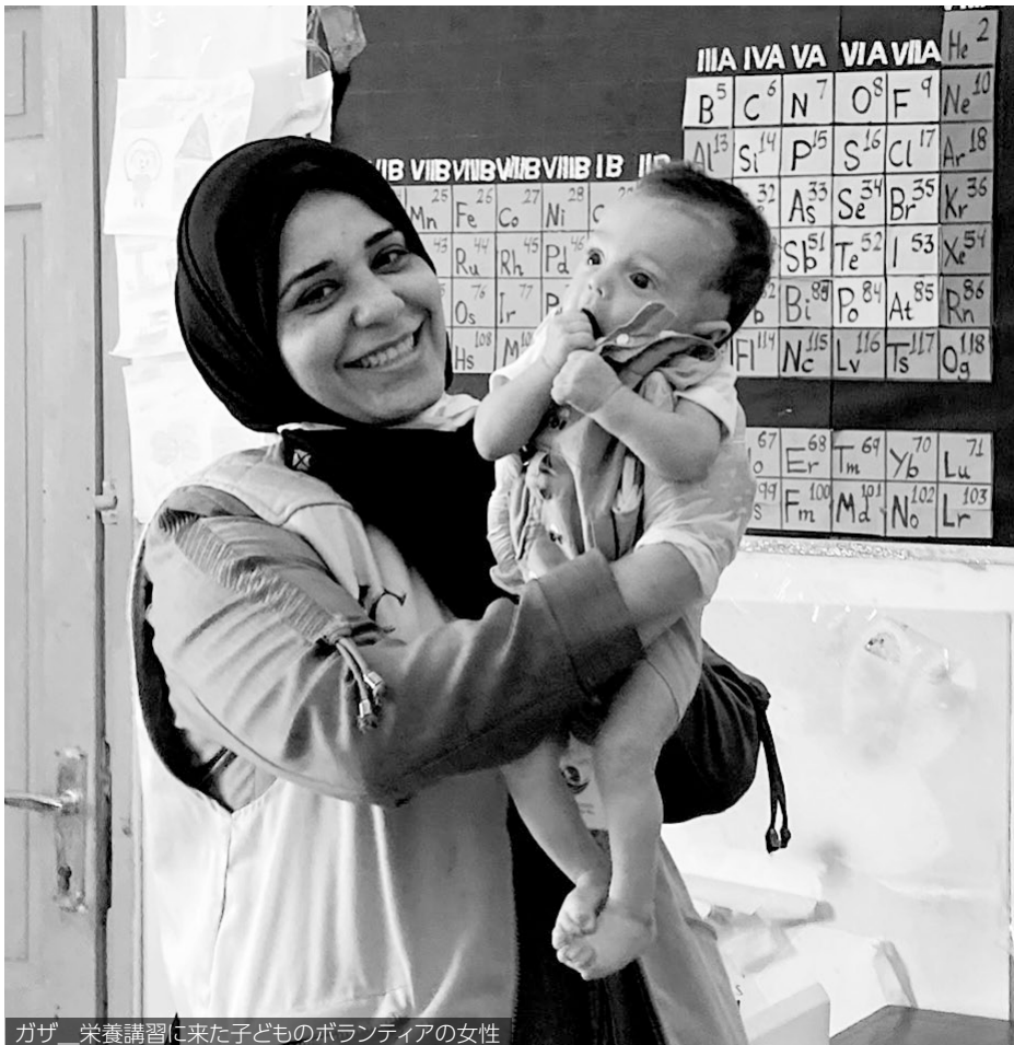
ガザ 栄養講習に来た子どものボランティアの女性

た男性たちが徐々に私たちの活動を理解し、力仕事などサポートしてくれるようになりました。今では、ラマダン中の食料配布やイベント時に男性住民がボランティアとして手伝ってくれます。 AWCは理事もスタッフもすべて女性です。だからこそ、地域の女性が安心して活動に参加してくれます。理事に一人でも男性が入れば、その人が女性に対する理解がある人であっても、AWC全体が男性に支配されてしまうという危険もあるからです。今ではエルサレム市内でもパレスチナの女性をサポートする団体もいくつかありますが、調査研究、法律