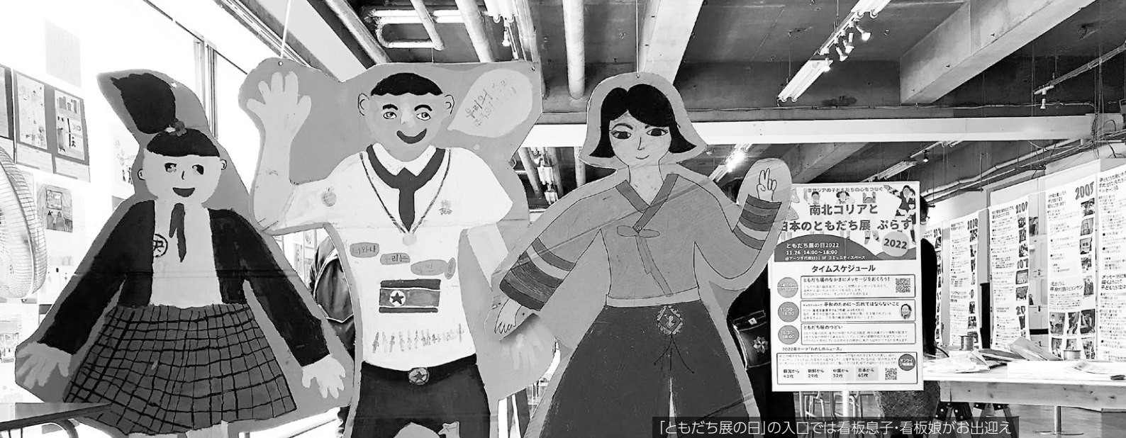
「ともだち展の日」の入口では看板息子・看板娘がお出迎え