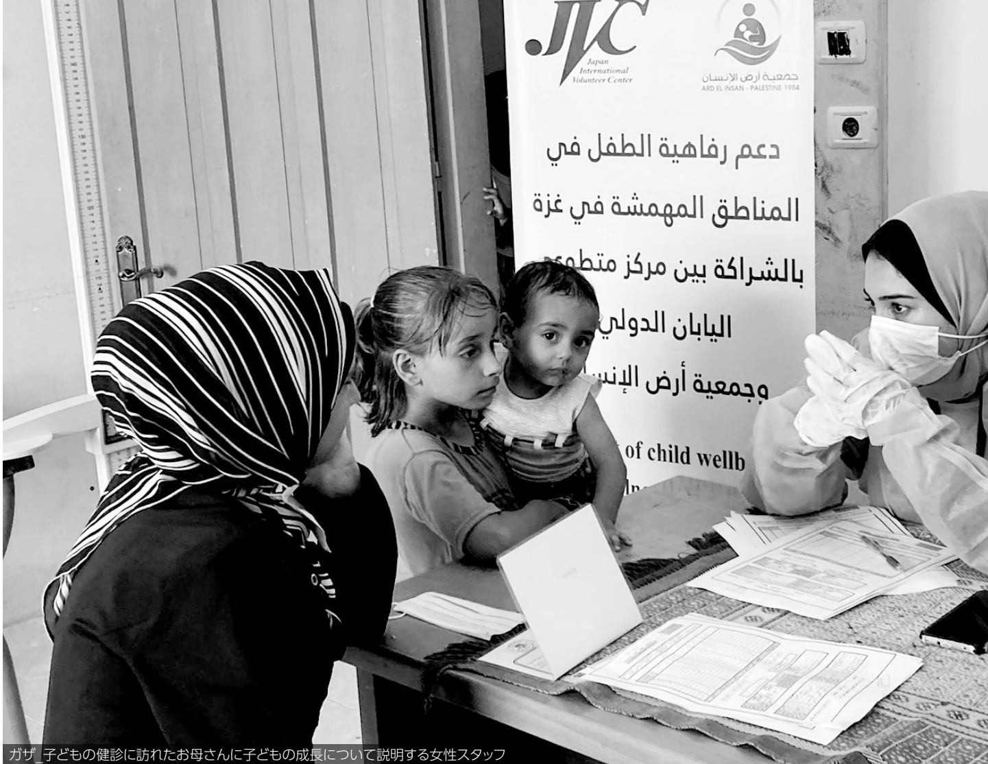
ガザ 子どもの健診に訪れたお母さんに子どもの成長について説明する女性スタッフ