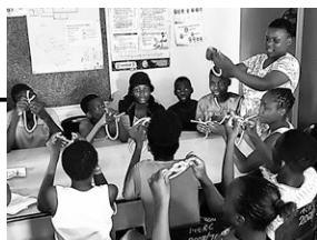
スカウト(年長組)の子どもたちが紐の結び方の学習をしているところ

親がいないなど厳しい家庭環境下に置かれた子どもたちに対し、リンポポ州の農村1村で「ムベゴ子どもケアセンター」と協働事業を行っています。センターは村の住民でもあるケアボランティア8名が運営し、約160名の子どもが通っています。