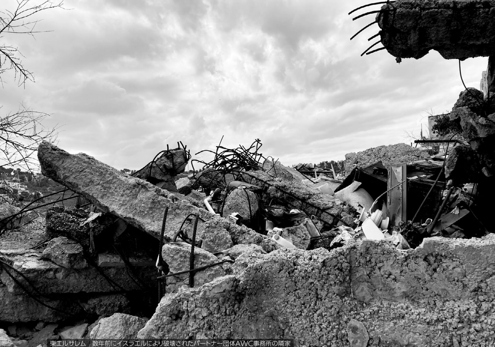
東エルサレム 数年前にイスラエルにより破壊されたパートナー団体AWC事務所の隣家