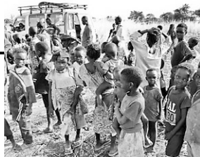
活動村での基礎情報収集の様子