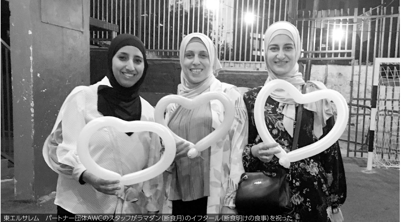
東エルサレム パートナー団体AWCのスタッフがラマダン(断食月)のイフタール(断食明けの食事)を祝った

母子保健サービスなどの活動を通じて、女性がコミュニティでリーダーシップを発揮し、社会的・経済的変化のための主体となるよう働きかけています。