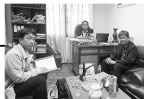
コンセッションについて、関係行政機関に住民との話し合いによる問題の解決を口頭で申し入れた際の様子

2村で地域の共有資源を持続的に管理、利用するための仕組みとして、コミュニティー林および魚保護地区を設置し、式典を実施しました。今後は村人によって持続的に運用されていく見通しとなりました。