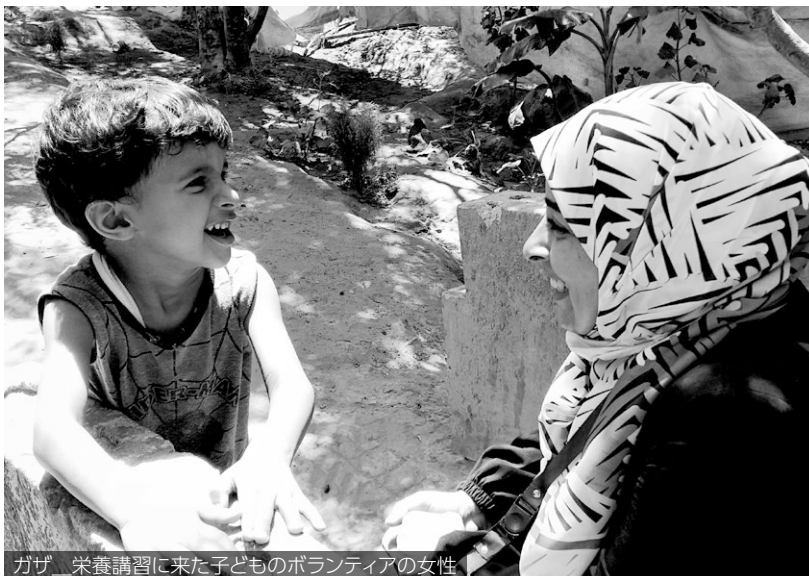
ガザ 栄養講習に来た子どものボランティアの女性

AWCの設立当初は周辺住民 (特に男性)から奇異な目で見ら れることも多く、地域の男性の