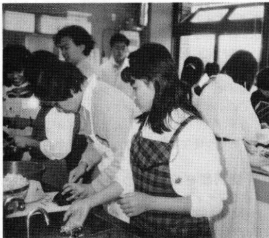
大和の料理教室で

ボランティアとして関わる一人一人も常に問われる。一方的に週に2時間だけ、日本語を教えているうちはいい。彼らが、自分の家に入ってきた時、どんな顔をして迎えたらいいか。異なった者が入っ