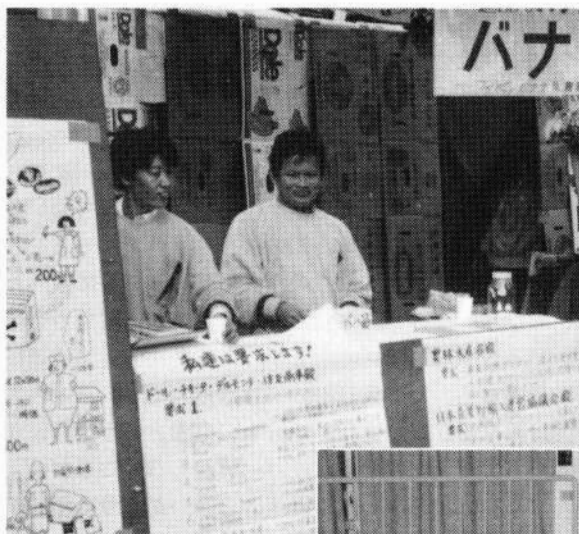
▲ フィリピンバナナ反農薬キャンペーンに参加するレックさん(右側)