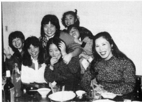
◀パーティはみんなの楽しみ (左から3番目が筆者)