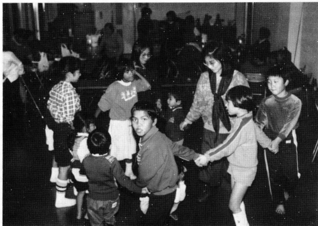
かごめかごめもおほえたよ