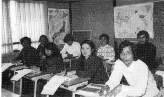
インドシナ難民が日本の対外国人政策を変えさせた

南アフリカのアパルトヘイトについての制裁も同じ考え方でしょう。欧米では今までの経験から、差別というのは結局百万偏念仏を唱えてもなくならない、積極的な介入をしなければ差別解消には向かわ