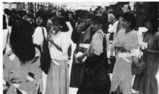
アジアから働きにやってくる女性たちの表情は明るい

重要な外交イベントのたびに難民政策は変わってきた。そして79年に「国際人権規約」を批准するわけです。そのことによって、公団住宅、公営住宅、住宅金融公庫、国民金融公庫が、1980年外国人に開放されたのです。これは人権規約に加入したことに伴う国内措置です。「公」や「国民」という言葉は刃物みたいなものです。国民健康保険というのは外国人を入れてやらない健康保険、国民体育大会は