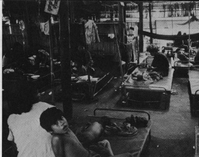
ARCの小児病棟（ノンサメット）

JVCのチームも、毎週1回木曜日、月1回土曜日にこの巡回診療に参加し、X線撮影だけでなく、私たちが患者の診察にあたっています。