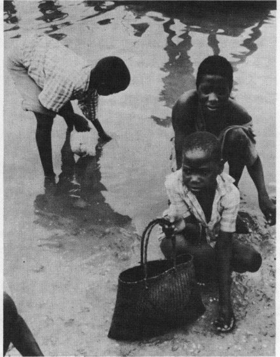
モザンビーク

3月16日、モザンビークの政府は、南アフリカ共和国(南ア)と不可侵条約を結ぶにいたった。モザンビークは、人種差別政策をとる南アに対する、黒人解放運動を支援し、難民を受入れてきた。そのため南アから武力攻撃を受けるなど、対立を深めていたのである。妥協を迫られたモザンビークの、せっぱつまった状況に対して、国際社会の迅速な対応が求められている。(編集部)