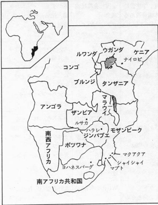
(世界年鑑 '84 より)