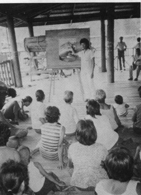
タブラヤ郡病院の巡回診療

カンボジア人の難民村であるバンサンゲーでは、2つある外国民間団体の病院のひとつに行きます。その病院の医師の注文に応じて、JVCチームは、結