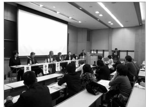
■多くの方が熱心に話を聞く。

私たちJVCは、2001年10月のアフガン空爆が始まってから一貫して「武力によらない解決」を訴えてきました。そこで、いま改めてアフガニスタン現地の人々の声に耳を傾けるとともに、日本および国際社会がアフガニスタンにどう関わるべきなのかを考えるために今回のシンポジウムを企画しました。